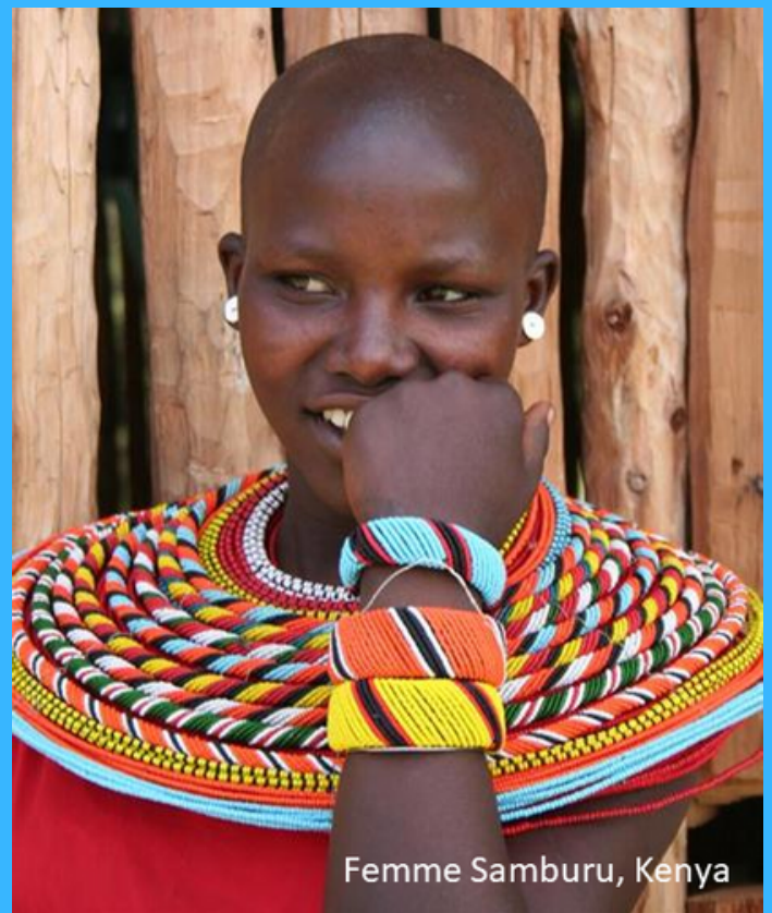
Femme Samburu, Kenya

Toutefois, le chemin est encore long pour les communautés traditionnelles telles que celles-ci.